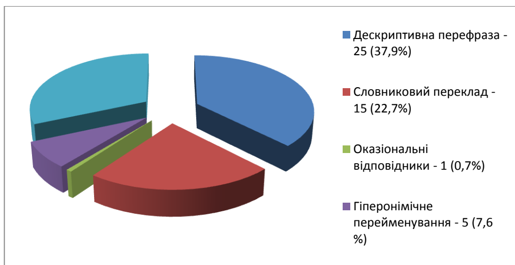
Рис. 1 Діаграма кількісних показників залучення різних способів семантизації безеквівалентної лексики в романі “Сладкая соль Босфора”