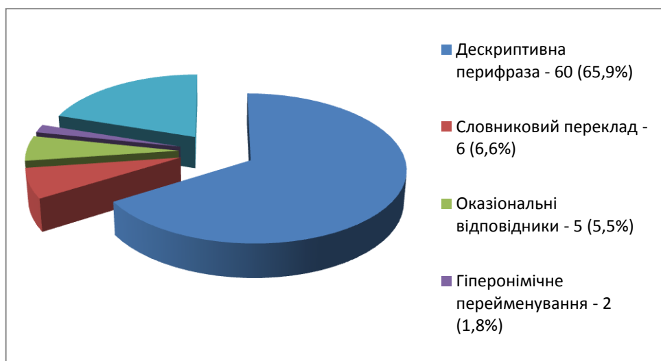
Рис. 2 Діаграма кількісних показників залучення різних способів семантизації безеквівалентної лексики в романі “Waiting for the Tulips to Bloom”