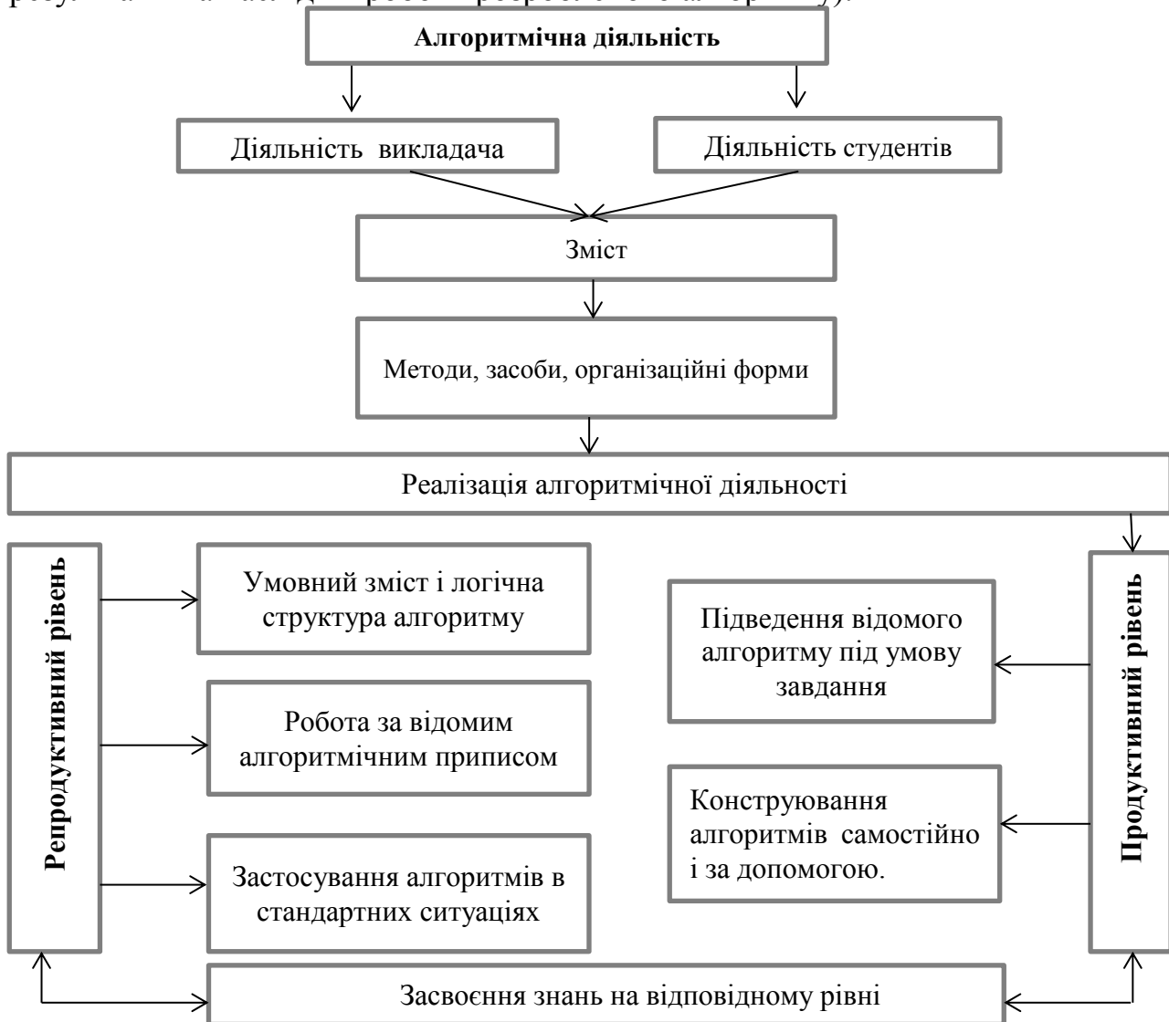
Рис. 2. Структурна модель реалізації алгоритмічної діяльності

аналогічних прикладах; конструювання особистого алгоритму на основі аналогій; конструювання власного алгоритму вирішення незнайомого завдання на основі наявних знань; конструювання загального алгоритму для вирішення певного класу задач; усвідомлення та коментування причин, проміжних результатів та наслідків роботи розробленого алгоритму).