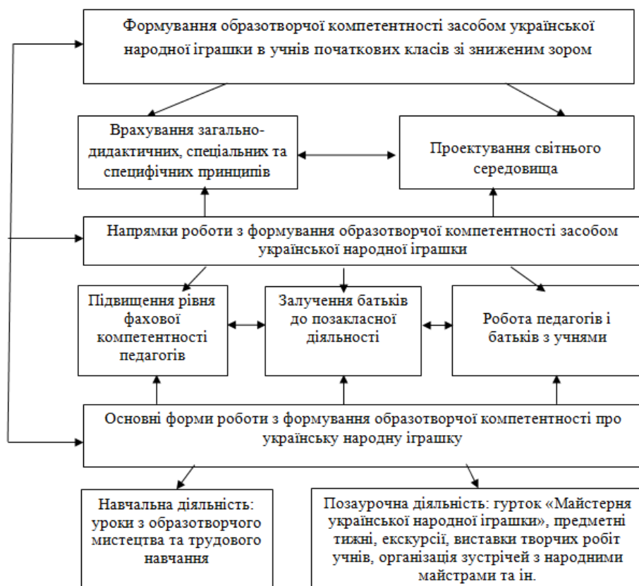
Рис. 3. Схема експериментальної корекційно спрямованої методики з формування в учнів початкових класів зі зниженим зором образотворчої компетентності засобом української народної іграшки

навчання у змістовій лінії «Декоративно-ужиткове мистецтво»; визначення переліку практичних завдань з тем уроків, в яких розглядається українська народна іграшка; запровадження у позаурочній роботі тематичних тижнів «Українська народна іграшка».