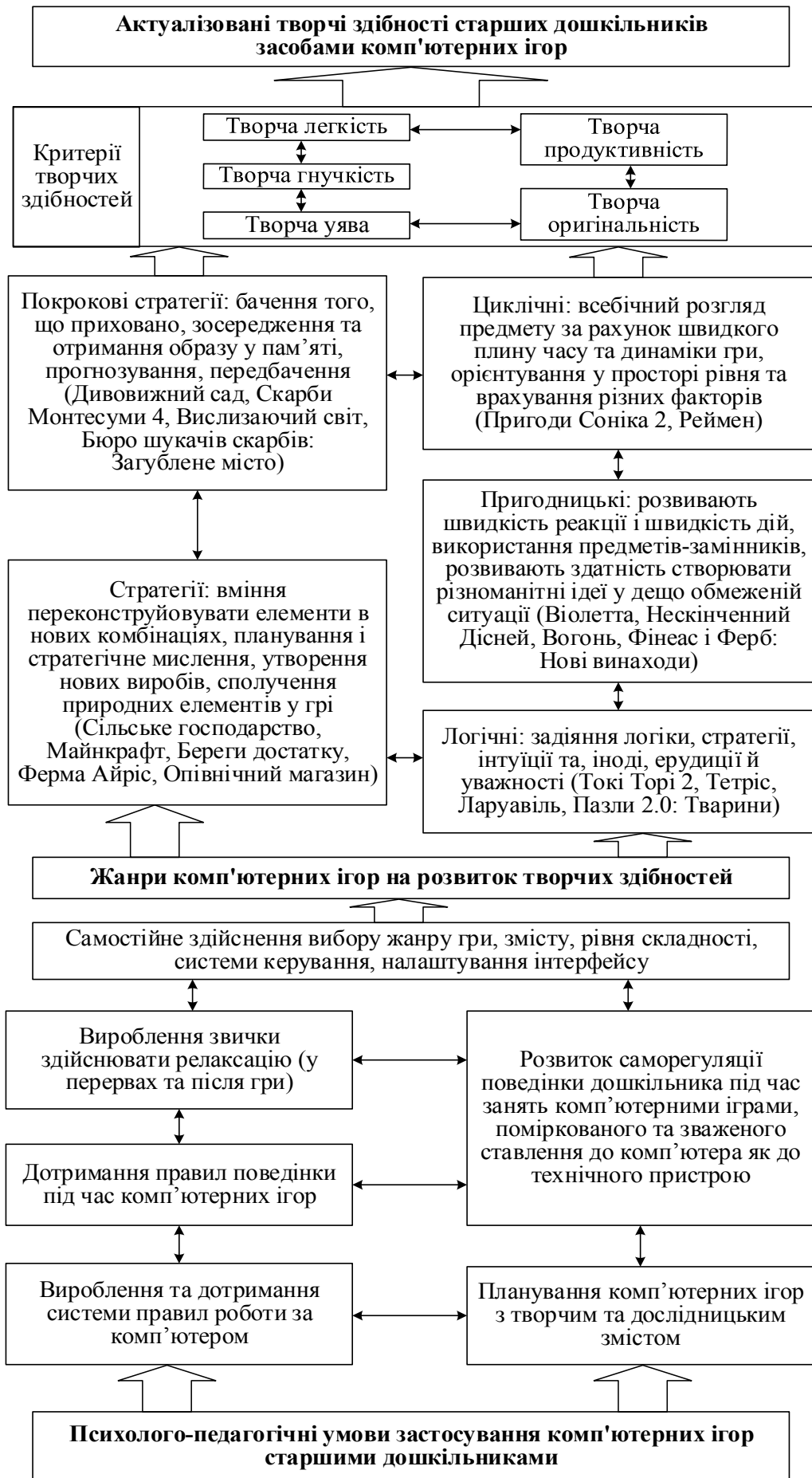
Рис. 1. Модель розвитку творчих здібностей старших дошкільників засобами комп'ютерних ігор