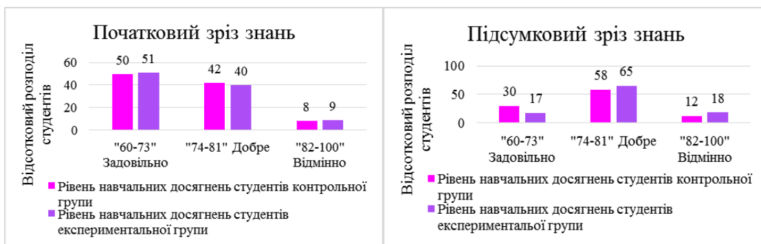
Рис. 3. Гістограми зміни рівнів навчальних досягнень з фізики студентів на початковій та завершальній стадії педагогічного експерименту

Апробація та впровадження педагогічного експерименту відбувались протягом 2013-2020 рр. У ньому були задіяні 395 студентів спеціальності 192 «Будівництво та цивільна інженерія» з яких: 190 в контрольній групі, 205 в експериментальній групі. Педагогічна доцільність використання запропонованої методичної системи та розробленого навчально-методичного комплекту перевірялась за такими показниками: 1) позитивна динаміка у рівнях навчальних досягнень студентів з фізики; 2) підвищення рівня мотивації студентів до вивчення фізики; 3) підвищення рівня фахової компетентності студентів. При визначенні рівнів навчальних досягнень студентів використовувались критерії, наведені у програмах з фізики для відповідної спеціальності і призначені для оцінювання рівня володіння студентами теоретичними знаннями; оцінювання навчальних досягнень при розв'язуванні задач; оцінювання навчальних досягнень при виконанні лабораторних та практичних робіт. Зміст контролю співвідносився зі змістом навчання. Статистичне опрацювання та інтерпретація результатів педагогічного експерименту дозволяє зробити такі висновки: за результатами підсумкового оцінювання видно, що рівень навчальних досягнень студентів експериментальних груп за шкалою ECTS з оцінкою «добре» перевищує рівень навчальних досягнень студентів контрольних груп на 7%, а з оцінкою «відмінно» на 6%, це продемонстровано на гістограмах ( рис. 3).