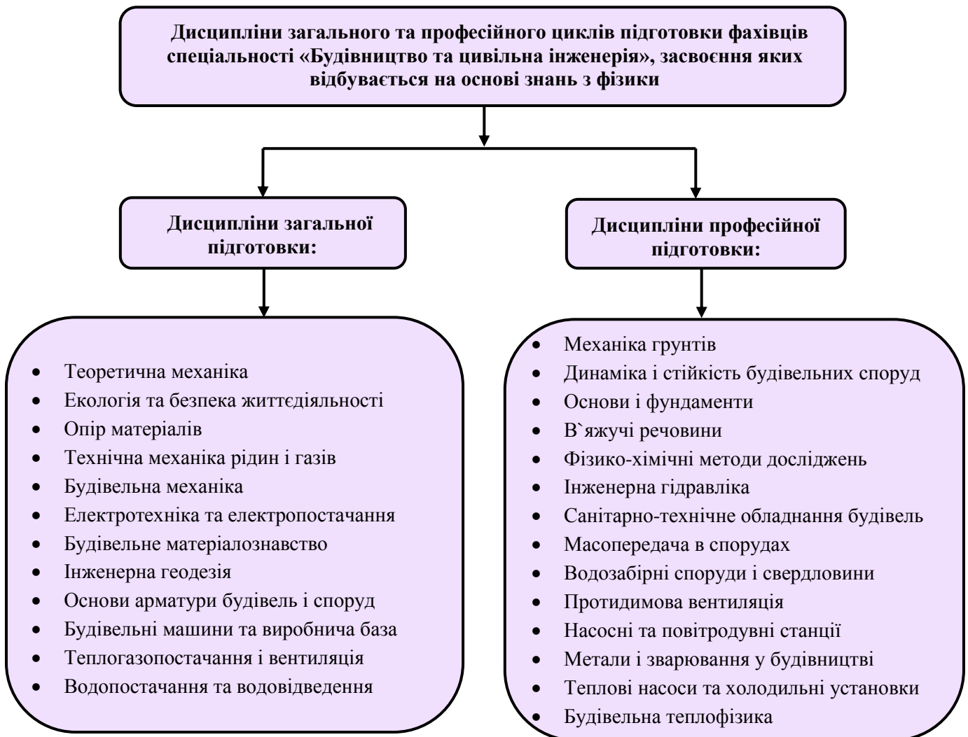
Рис. 1. Дисципліни загального та професійного циклів підготовки фахівців спеціальності «Будівництво та цивільна інженерія», засвоєння яких відбувається на основі знань з фізики

Доведено, що знання з фізики забезпечують успішне засвоєння дисциплін як загального, так й професійного циклів підготовки, що, у свою чергу, дозволяє ефективно сформувані спеціальні (фахові) компетентності. Визначено перелік дисциплін, засвоєння яких відбувається на основі знань з фізики (рис.1).