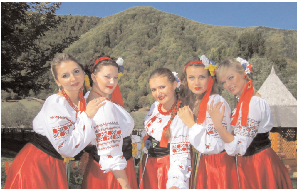
7 жовтня 2012 р. народний ансамбль "Купава" виступив з концертною програмою, присвяченою 597-й річниці з дня заснування селища Міжгір'я та відвідав оздоровчий комплекс "Синевир" Студентська рада

НАЦІОНАЛЬНОГО ПЕДАГОГІЧНОГО УНІВЕРСИТЕТУ ІМЕНІ М. П. ДРАГОМАНОВА