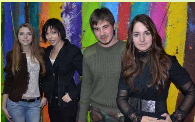
Вперше Драгомановський університет відвідала Ірена Карпа

Сергій РУСАКОВ, Юлія СУХЕНКО