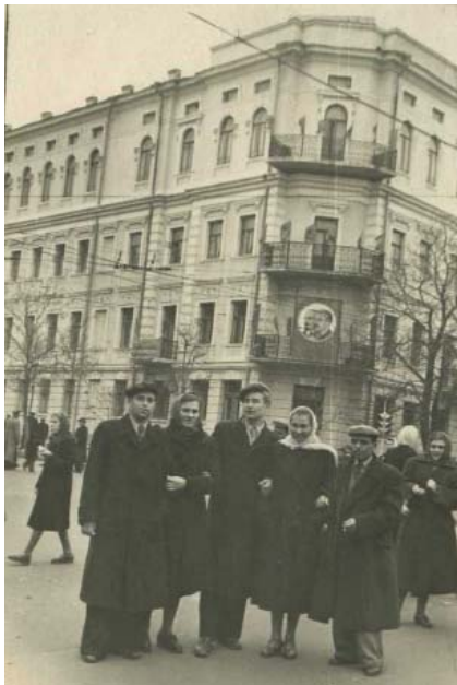
З однокурсниками біля стін педагогічного інституту імені О. М. Горького, 1953 р.

Колектив НПУ імені М. П. Драгоманова, кафедра теоретичної та консультативної психології Інституту соціології, психології та управління