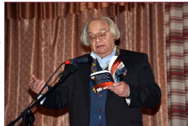
Поет зачитує вірші з нової збірки

Для слухачів приємною несподіванкою була зустріч з сином відомої художниці Алли Горської та Віктора Зарецького, директором музею “шестидесятників” Олексієм Зарецьким. Він образно сказав, що Муза не тільки часто навідується до знаменитого поета, а і надовго затримується. І тоді народжуються незвичайної глибини і мудрості рядки, які хочеться перечитувати знову і знову.