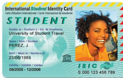
Рис. 4. Міжнародний студентський квиток ISIC

Популярним серед студентів є ISIC — міжнародне посвідчення особи і статусу студента (International Student Identity Card), створене Міжнародною Конфедерацією Студентського Туризму в 1953 році під егідою UNESCO, яке має спільну з ISIC мету — підтримувати спілкування активних, допитливих, відповідальних студентів.