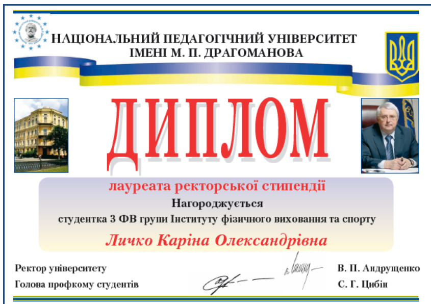
Рис. 2. Диплом лауреата іменної стипендії

Кожний студент, лауреат іменної стипендії, нагороджується Дипломом лауреата іменної стипендії Національного педагогічного університету імені М.П.Драгоманова.